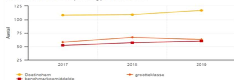
Grafiek 2.1. Klanten schuldhulpverlening per 10.000 inwoners

(Divosa benchmark 2019, aantal klanten schuldhulpverlening per 10.000 inwoners)