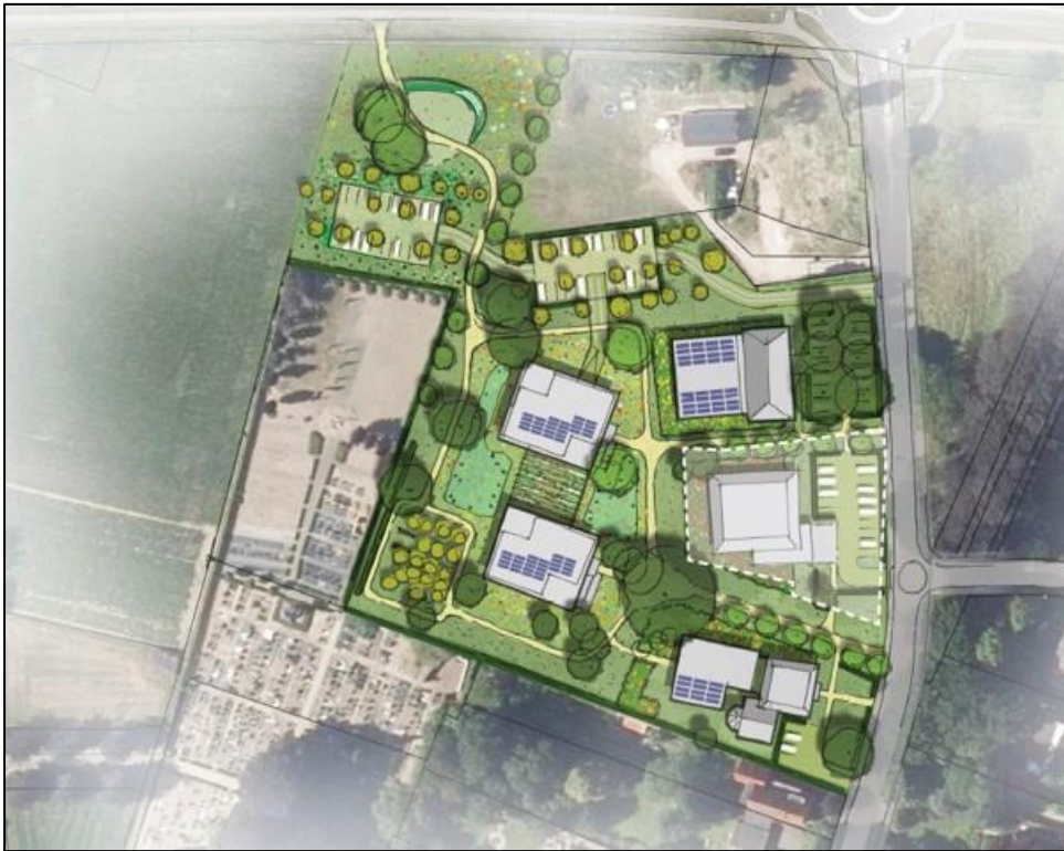
Globale stedenbouwkundige schetsontwerp van het plangebied (toekomstige situatie)

In de onderstaande figuur is het stedenbouwkundige schetsontwerp voor de beoogde nieuwbouw en daarmee de globale ligging van de vier gebouwen met de nieuwe appartementen weergegeven in de toekomstige situatie. Behalve de nieuwbouw van de appartementengebouwen zal het plangebied ook landschappelijk ingepast worden met diverse paden, groenvoorzieningen en parkeerplaatsen.