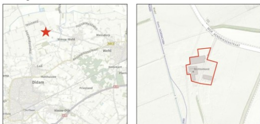
Ligging van het plangebied

Het plangebied is gelegen aan de Monseigneur Hendriksenstraat 29 in het buitengebied van de gemeente Doetinchem en ligt ten westen van de kern Wehl. De onderstaande afbeelding laat de ligging van het plangebied zien.