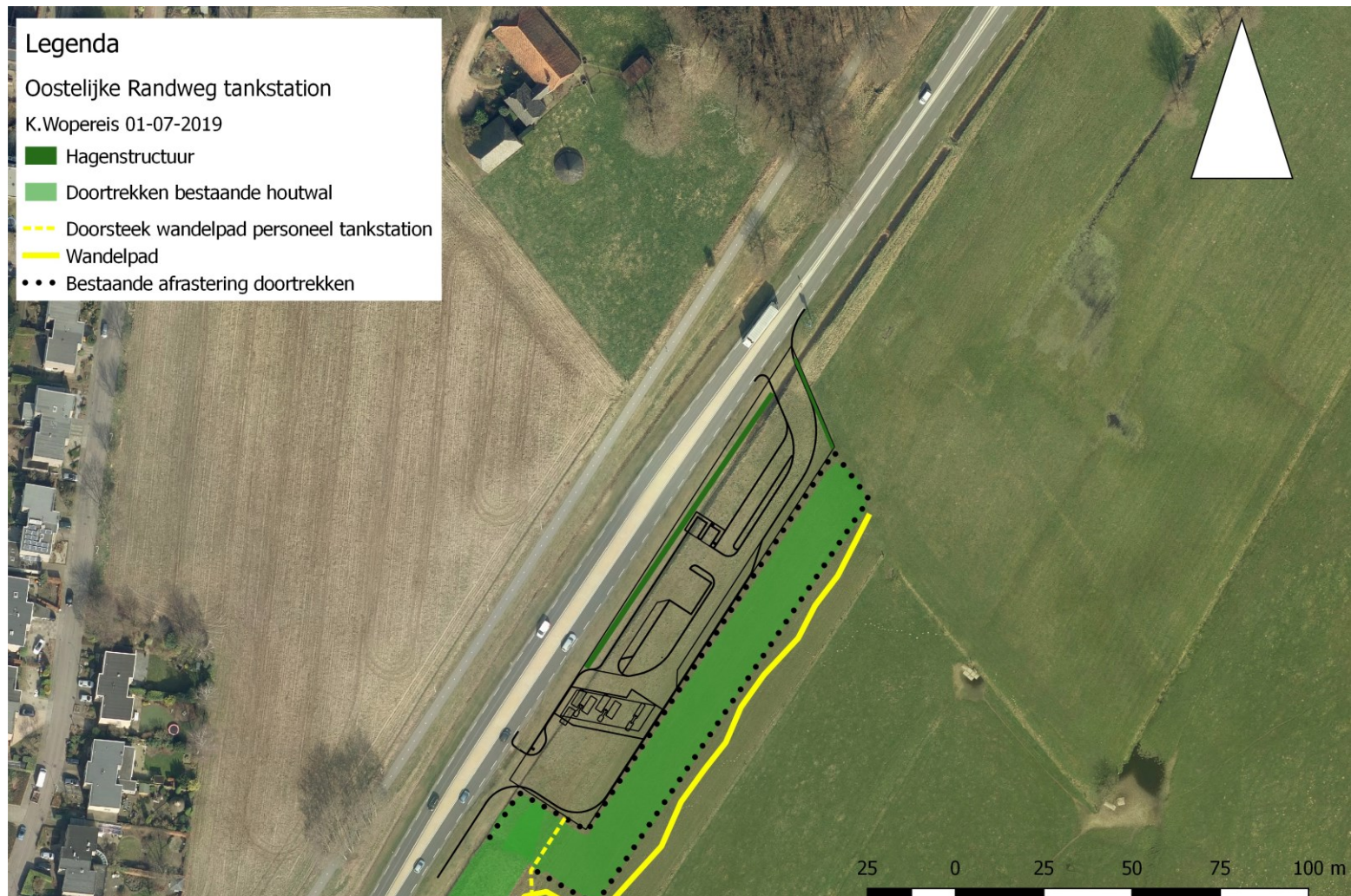
Figuur 1 Landschappelijke inpassing tankstation Oostelijke Randweg