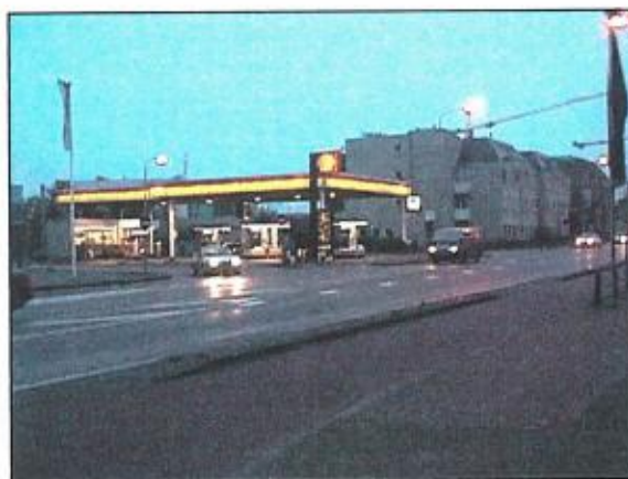
Figuur 1: Shell-station Keppelseweg

Daarnaast is er een shop aanwezig waar men terecht kan voor diverse autoservice produkten maar ook voor kleine aankopen (zie figuur 1). Met name de schaal en het feit dat er verschillende brandstofsoorten verkocht worden, maken juist deze verkooppunten geschikt voor vestiging op plaatsen welke goed bereikbaar zijn en niet in of dicht bij de woonbebouwing liggen. Ook de route voor de bevoorrading van