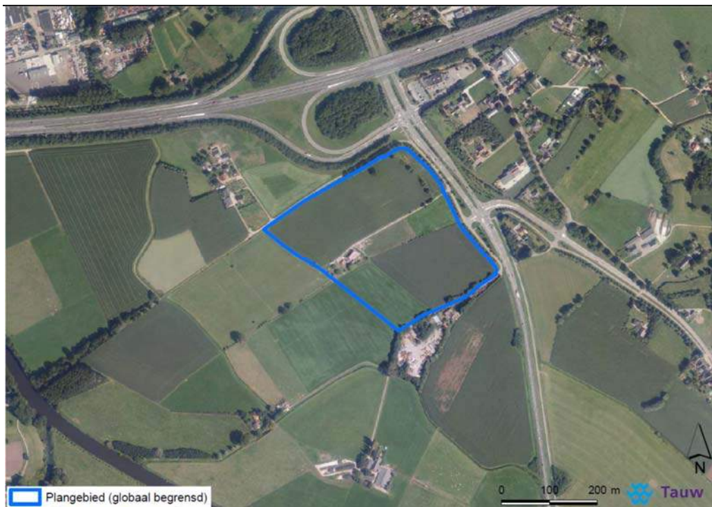
Figuur 1.1 Ligging plangebied (globaal begrensd door de blauwe contour)

Slingeland Ziekenhuis heeft het voornemen een nieuw ziekenhuis te realiseren aan de zuidkant van de A18 nabij afslag 4 in Doetinchem (zie figuur 1.1). In verband met de realisatie van het nieuwe ziekenhuis wordt een nieuw bestemmingsplan opgesteld. Ten behoeve van deze ontwikkeling dienen een aantal (milieu)onderzoeken uitgevoerd te worden. In deze notitie is het thema bedrijven en milieuzonering nader onderzocht.