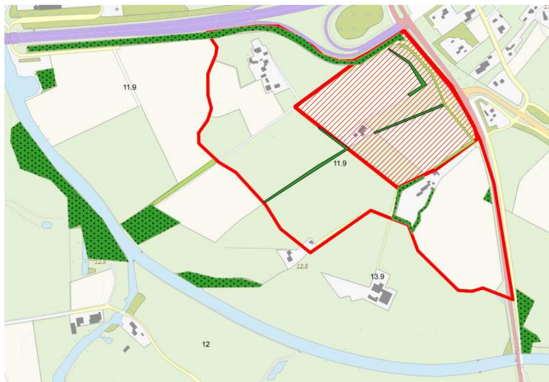
Figuur 3. Versimpelde weergave van de aanwezige ecotopen, als onderdeel van de kernwaarden. In donkergroen gefragmenteerde houtwallen, met bolletjespatroon bosschages en in lichtgroen bomenlaan.

Door de staat van de hagen en het lokaal ontbreken van lijnvormige elementen, heeft het plangebied niet de waarden die het in potentie in zich draagt, zowel op natuur als op landschappelijk vlak. Zie Figuur 3 voor een versimpelde weergave van de aanwezige ecotopen, als onderdeel van de kernwaarden. Hierop is niet zichtbaar wat de kwaliteit van de elementen is.