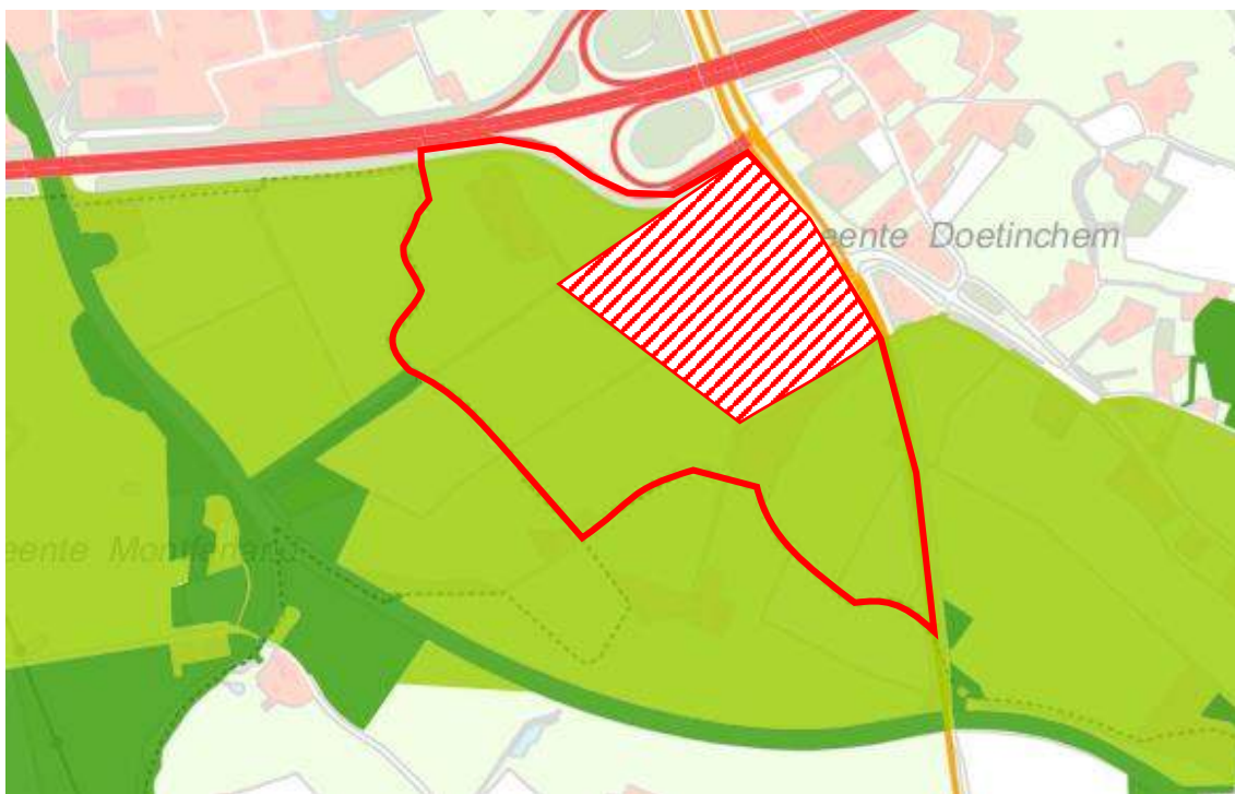
Ligging van het plangebied (rood) in de GO (licht groen) en nabij het GNN (donker groen).