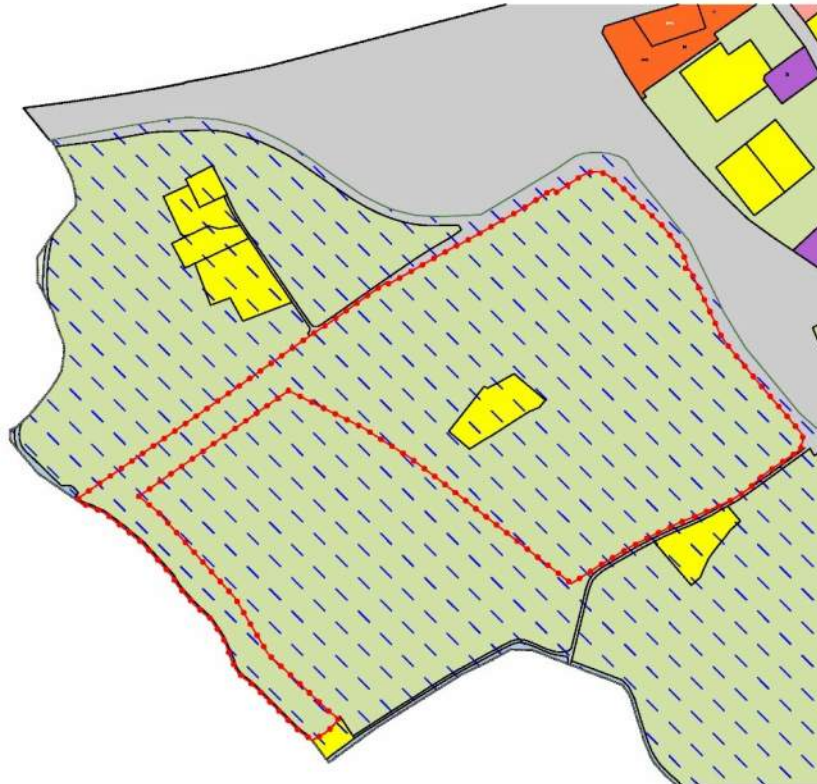
Bestemmingsplan Buitengebied – 2012 & plangrens bestemmingsplan Ziekenhuis – 2017. Diagonale blauwe stippellijn is GO