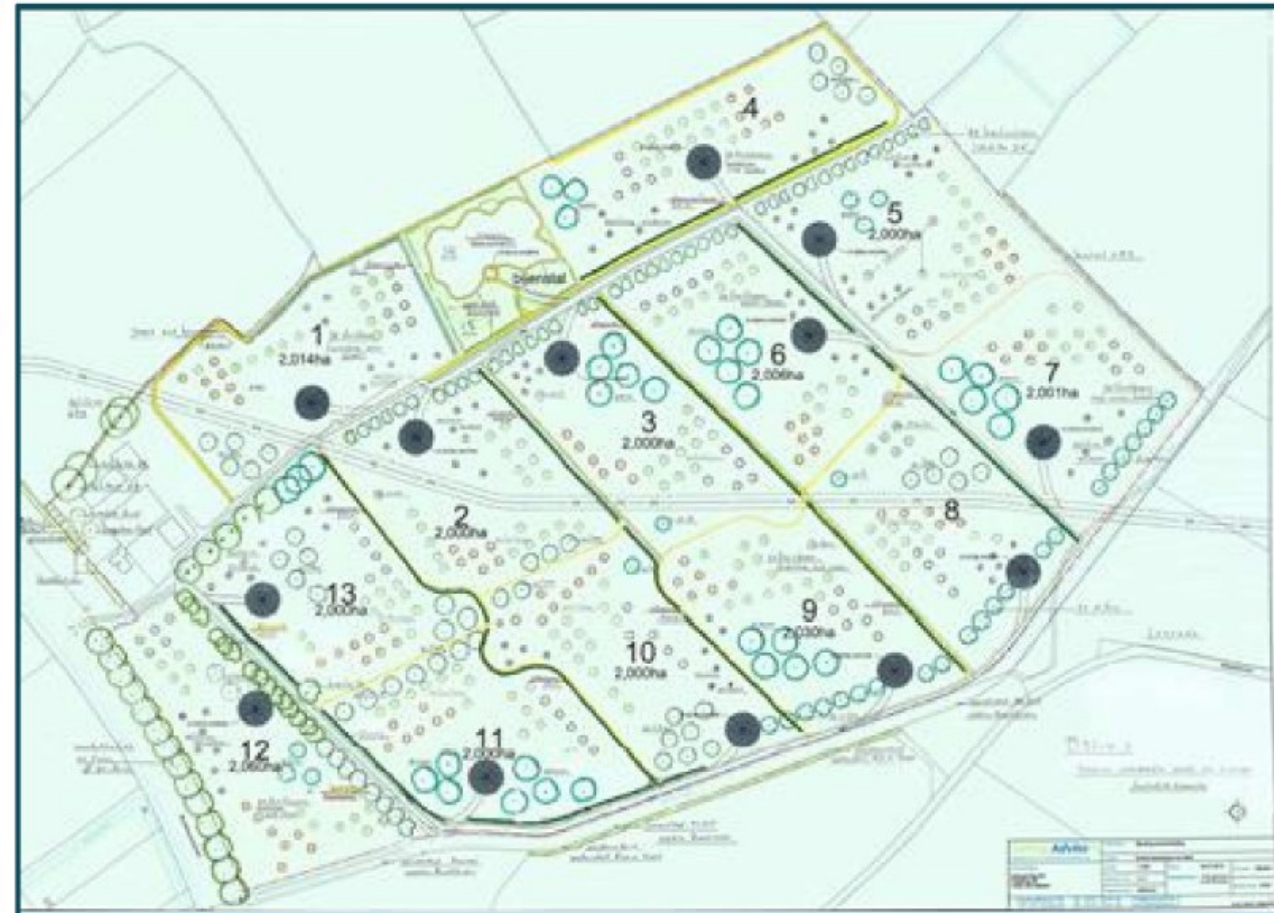
Figuur 4 Landschappelijke inpassing