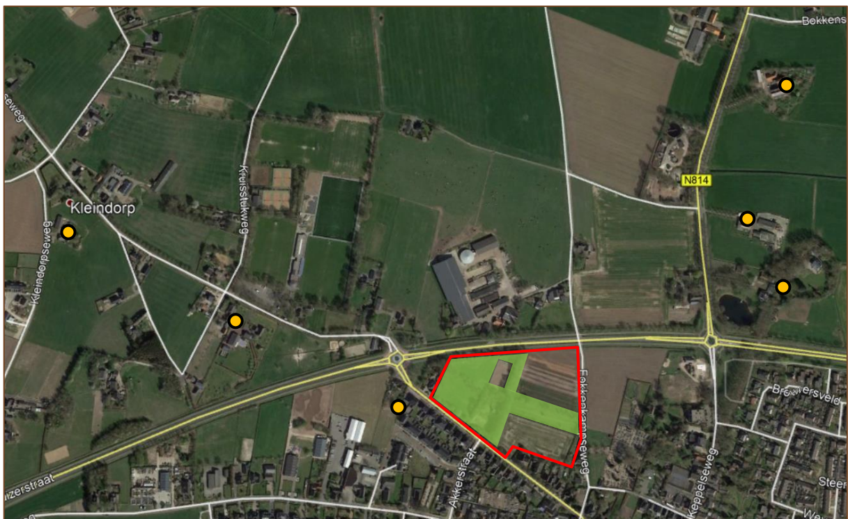
Figuur 4. Nestlocaties steenuil (oranje) in relatie tot het Fokkenkamp (rood), op basis van nestgegevens STONE, NDFF en gericht veldonderzoek 2021. Met groen zijn geschikte foerageergebieden binnen het plangebied aangegeven die mogelijk tot het functioneel leefgebied van de steenuil behoren.

Gebruik van het plangebied door overige steenuilenterria in de omgeving, zoals de bekende locaties aan de Keppelseweg, Kleindorpseweg en Kruisstukweg, wordt niet verwacht of beperkt zich hooguit tot een incidenteel bezoek. Door de concurrentie met het steenuilenpaar aan de Doesburgseweg 23, de fysieke afstand tot het plangebied, de mogelijke barrièrewerking van de tussenliggende provinciale wegen en de aanwezigheid van voldoende geschikt leefgebied direct rondom de nestlocaties is geen sprake van functioneel leefgebied van overige steenuilenparen.