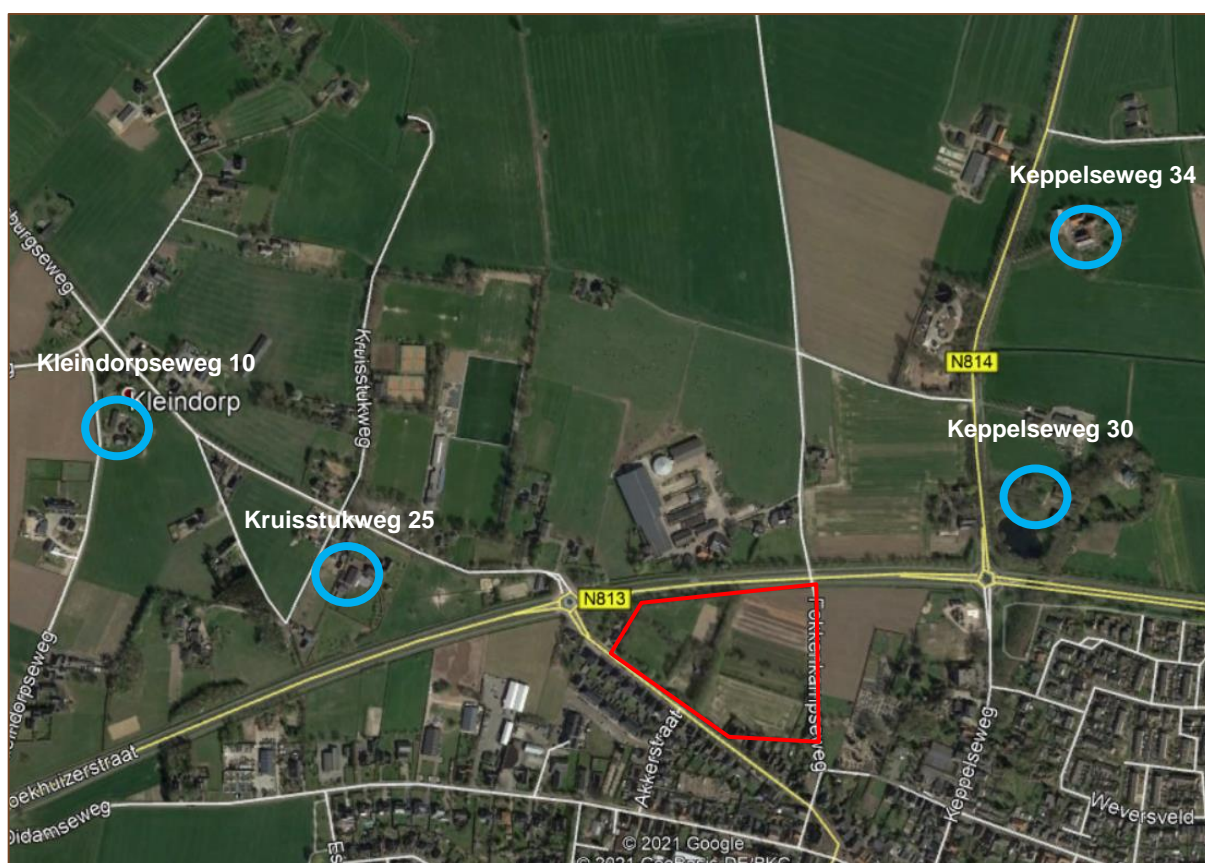
Figuur 3. Recente waarnemingen van bekende nestlocaties van de steenuil (blauwe cirkels) vanuit de omgeving van het plangebied (rood).