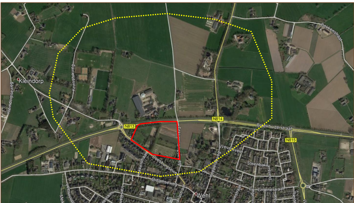
Figuur 2. Luchtfoto van het onderzoeksgebied (geel) met daarin het plangebied (rood), bron: Google Earth (2021).