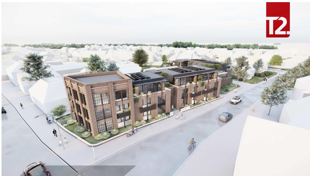
Zijaanzicht vanaf het kruispunt Rijksweg en Vulcaanstraat

Het voornemen bestaat om aan de Vulcaanstraat 1-3 te Gaanderen 22 nieuwbouwappartementen te realiseren. Vanuit de gemeente is middels een principebesluit positief op het plan gereageerd. De gemeente Doetinchem geeft aan dat er een ruimtelijke onderbouwing opgesteld moet worden en dat de nodige onderzoeken uitgevoerd moeten worden. De gemeente dient de ruimtelijke onderbouwing goed te keuren alvorens de procedure wordt gestart voor het aanpassen van het bestemmingsplan.