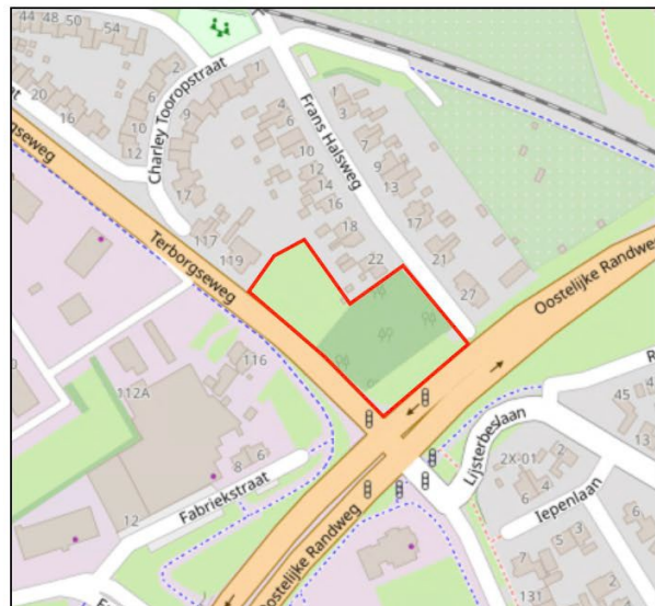
Afb. 1. De ligging van het onderzochte gebied (in rood).