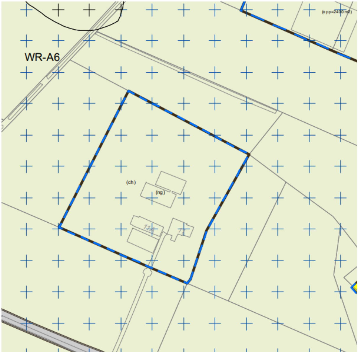
Uitsnede beheersverordeningkaart 'Landelijk gebied - 2020, reparatie 2022'