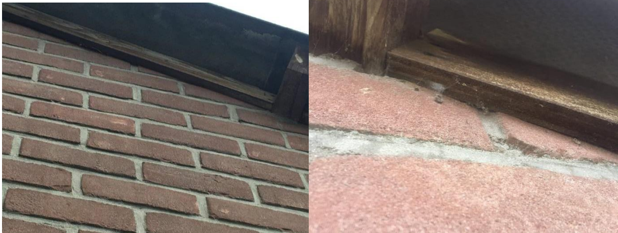
De betimmering van het dakoverstek sluit naadloos aan op de buitengevels.

Er zijn tijdens het veldbezoek geen vleermuizen waargenomen en er zijn geen aanwijzingen gevonden dat vleermuizen een rust- of voortplantingsplaats in het plangebied bezetten. De bebouwing beschikt weliswaar deels over luchtsponw maar er zijn geen invliegopeningen zoals open stootvoegen of ventilatieopeningen aangetroffen die vleermuizen de kans bieden een verblijfplaats te bezetten. Ook sluit de betimmering van het dakoverstek naadloos aan op de buitengevels. De werktuigenberging is voor vleermuizen toegankelijk maar er zijn geen aanwijzingen gevonden dat vleermuizen er een verblijfplaats bezetten. Verblijfplaatsen van vleermuizen in gebouwen zijn doorgaans eenvoudig vast te stellen aan de hand van uitwerpselen op de grond onder de hangplek. Verder zijn in het plangebied geen potentiële verblijfplaatsen van vleermuizen waargenomen, zoals een holle ruimte achter een boeiboord, windveer, loodslab, vensterluik, zonnewering of gevelbetimmering aangetroffen. Er zijn in het plangebied geen holenbomen vastgesteld.