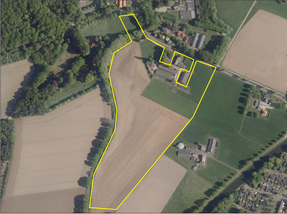
Begrenzing van het plangebied; deze wordt met de gele lijn aangeduid.