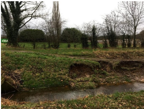
Amfibieën kunnen een (winter)rustplaats bezetten langs de oever van de beek.

Tijdens het veldbezoek zijn geen amfibieën waargenomen, maar gelet op de inrichting en het gevoerde beheer, wordt het plangebied als functioneel leefgebied voor sommige algemene en weinig kritische amfibieënsoorten beschouwd. Amfibieën als bruine kikker en gewone pad benutten het plangebied als foerageergebied en mogelijk bezetten ze er een (winter)rustplaats. Deze soorten kunnen een (winter)rustplaats bezetten in holen en gaten in de grond, onder strooisel en bladeren en langs de oever van de beek. De werktuigenberging is weliswaar voor amfibieën toegankelijk maar is op enkele agrarische voertuigen na helemaal leeg en vormt daardoor geen geschikte (winter)rustplaats voor amfibieën. De overige bebouwing is voor amfibieën niet toegankelijk en daardoor niet geschikt om een (winter)rustplaats in te bezetten. Het intensief beheerd agrarisch cultuurland vormt geen geschikt leefgebied voor amfibieën. Het plangebied wordt niet als functioneel leefgebied van zeldzame amfibieënsoorten als kamsalamander, rugstreppad of poelkikker beschouwd. Geschikt voortplantingsbiotoop ontbreekt in het plangebied.