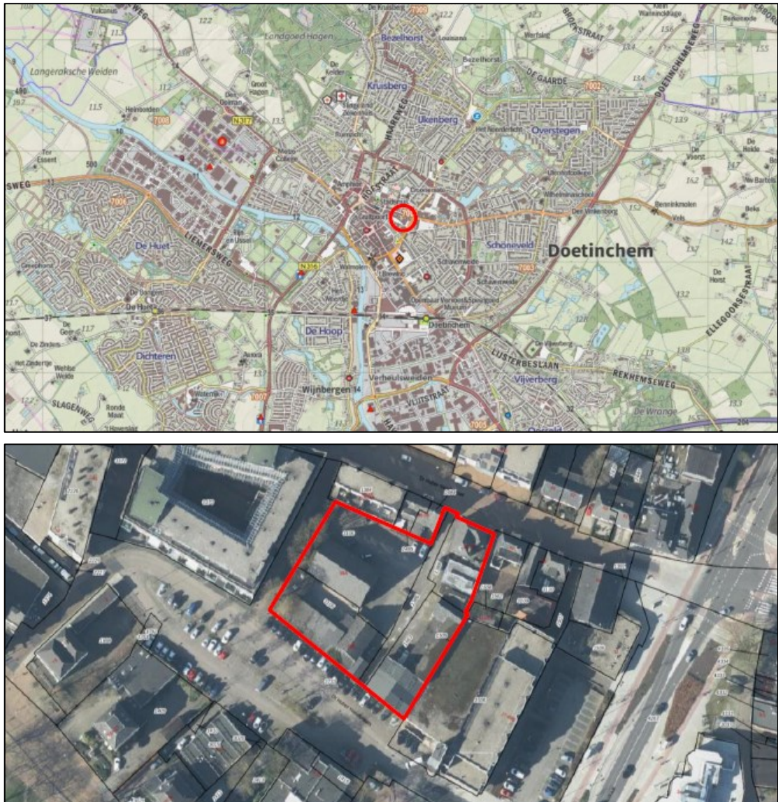
Figuur 1. De ligging en begrenzing van het plangebied aan de Dr. Huber Noodtplaats (Dr. Hubert Noodtstraat 38A, 38B, 40 en 42) te Doetinchem. Op de onderste afbeelding is het plangebied rood omlijnd weergegeven.