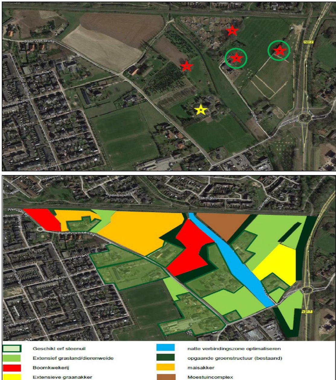
Figuur 2. De beoogde locaties van de twee alternatieve steenuilenkasten van het type UK ST 01 van Vivara Pro in het compensatiegebied (groen omcirkelde rode sterren). De andere twee rode sterren weergeven overwogen locaties, de gele ster weergeeft een bezet territorium van een ander steenuilenpaar. Na het bepalen van de twee meest geschikte locaties, worden de twee exacte locaties (twee van de rode sterren) waar de kasten opgehangen worden doorgegeven aan de provincie Gelderland. Op de onderste afbeelding is het compensatiegebied met de gerealiseerde en te realiseren elementen weergegeven.