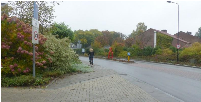
Foto 5: fietser op voetpad – Haareweg net na oversteek Begijnenstraat

Het is de bedoeling dat fietsers gebruik maken van de nieuwe routes. Hier moeten ze aan wennen. Dit kun je met infrastructuur niet afdwingen. Het zou goed zijn als dit besproken wordt op school of met/via ouders.