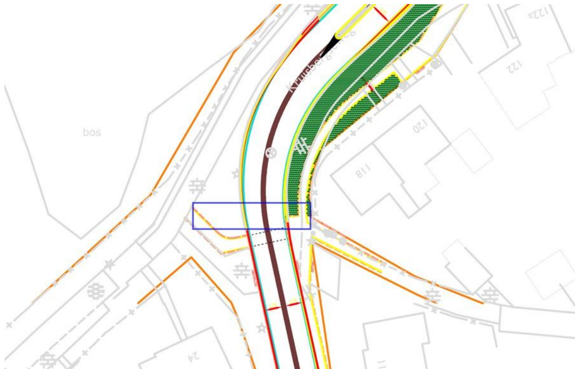
Figuur 1: Blauwe getekende vak geeft aan waar ROV de fietsoversteek Begijnenstraat-Kruisbergseweg vanuit gedragsoverwegingen zou plaatsvinden.

opstelruimte. Dit is als een blauw vak ingetekend in figuur 2 . De oversteek komt dan wel dichterbij de bocht, maar het nadeel daarvan weegt in onze ogen op tegen het voordelen: meer ruimte, betere zichtbaarheid, een beter zicht van de fietser op naderend verkeer.