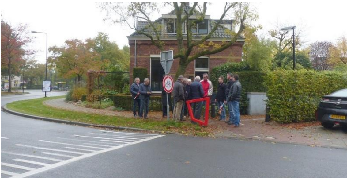
Foto 6: Zoeken naar oplossingen tijdens de evaluatie d.d. 22 oktober 2015

De oversteek is een compromis. Alle onderzochte locaties hadden voor- en nadelen. Deze oversteek leek de beste optie.