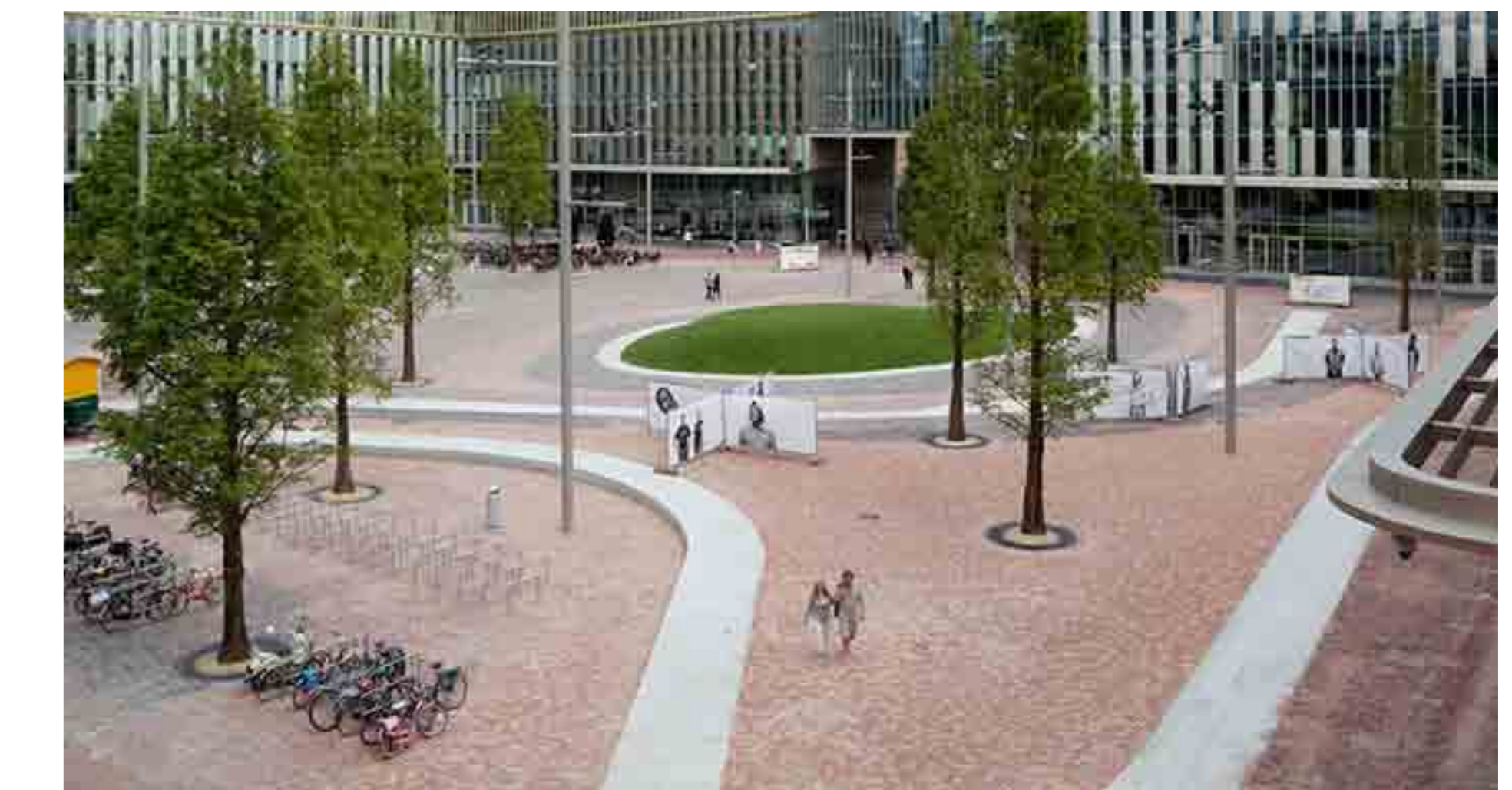
totaal beeld en bestrating - elementverharding