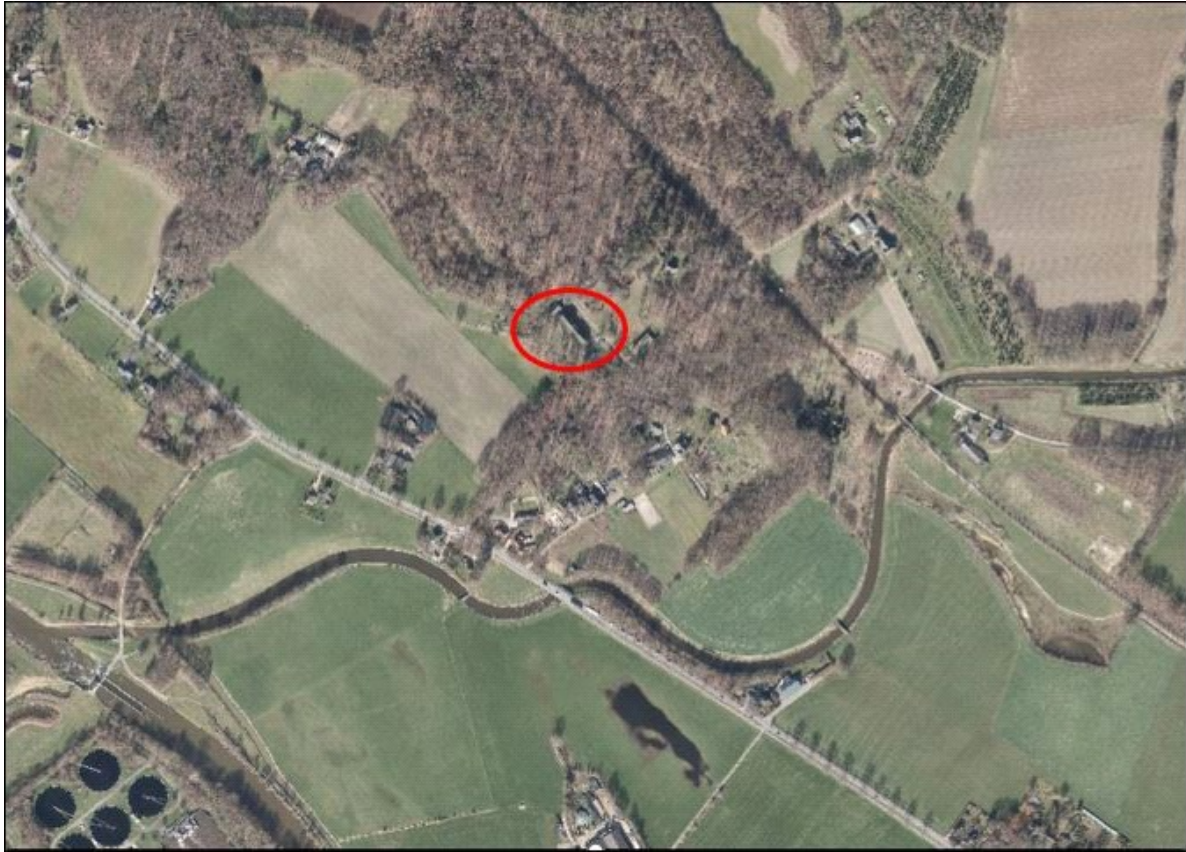
Ligging plangebied in directe omgeving