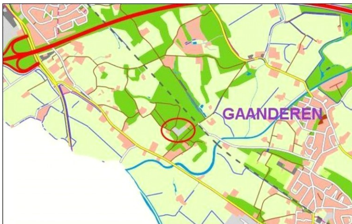
Ligging plangebied ten opzichte van Gaanderen

Het plangebied is gelegen aan de Hulleweg 5 en 7 in het buitengebied van de gemeente Doetinchem. Het betreft de kadastrale percelen Ambt-Doetinchem, sectie L, perceelnummers 5411 en 5400. De onderstaande afbeeldingen laten de ligging van de locatie zien.