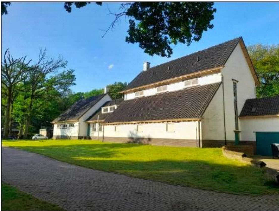
Impressies voormalig pompstation