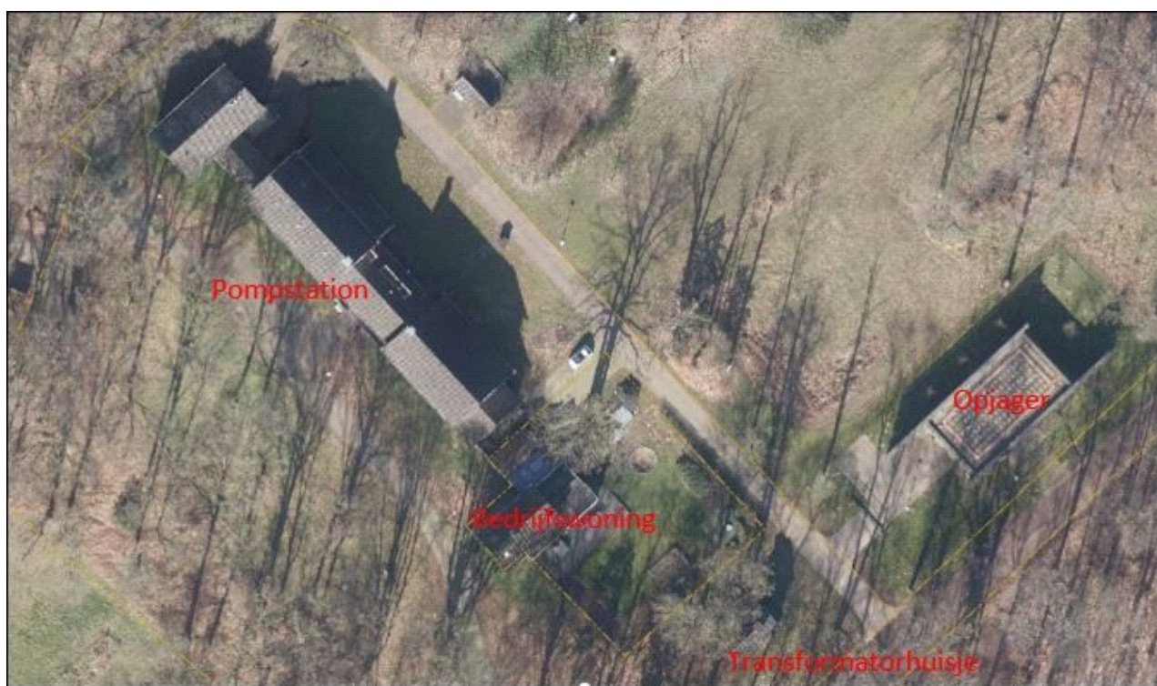
Luchtfoto huidige situatie

Het plangebied is gelegen op de voormalige Vitenslocatie aan de Hulleweg 5 en 7 in Doetinchem. Op deze locatie was een pompstation (Hulleweg 5) gevestigd en een bedrijfswoning (Hulleweg 7). Op de locatie Hulleweg 7a is nog een opjager van Vitens gevestigd en deze is nog in bedrijf. Deze locatie ligt buiten het plangebied en behoudt de bestemming 'Bedrijf'. Het voormalige pompstation is een gebouw van cultuurhistorische waarde. Het heeft gedurende de planvorming een monumentenstatus gekregen (gemeentelijk monument). Zie bijlage 8 Bijlage 7 bij ROB - B&W besluit monumentenstatus . Dit gebouw wordt getransformeerd naar 4 woningen en 5 recreatiewoningen. Het transformatorhuisje op dit terrein maakt ook onderdeel uit van het plan en wordt eveneens getransformeerd naar een recreatiewoning. De voormalige bedrijfswoning krijgt een woonbestemming.