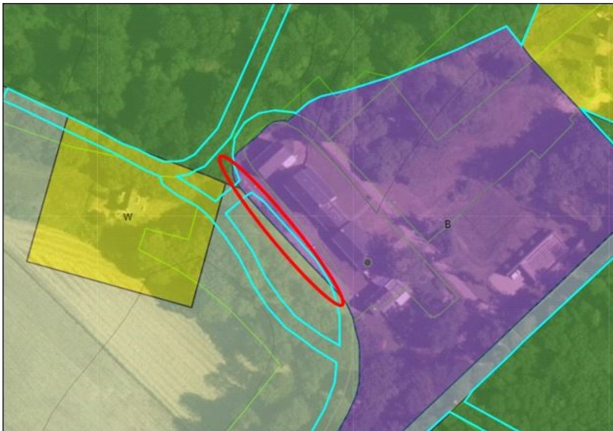
Situering bestemming Bedrijf in GO en GNN

De voorgenomen ontwikkeling heeft geen directe invloed op de Groene Ontwikkelingszone en het Gelders Natuurnetwerk die de provincie Gelderland in de Omgevingsverordening heeft vastgelegd. Een kleine strook dat opgenomen is als plangebied ligt binnen de GO en GNN. De reden dat deze perceeltjes meegenomen zijn in het plangebied is, omdat de huidige bestemming 'Bedrijf' geen recht meer doet aan deze perceeltjes (zie rode cirkel in afbeelding hieronder). Ze krijgen nu een meer bij GNN passende bestemming, namelijk de bestemming 'Bos'. Er zal fysiek niets veranderen en er wordt ook geen potentiële natuurwaarde weggenomen. De kernkwaliteiten, oppervlakte en samenhang worden daarom per definitie niet aangetast. Nader onderzoek en eventuele compensatieplannen zijn daarom niet nodig.